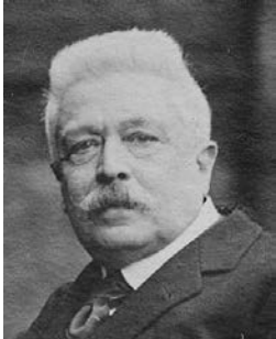
Дэвид Ллойд Джордж