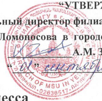
График учебного процесса на 2016-2017 учебный год